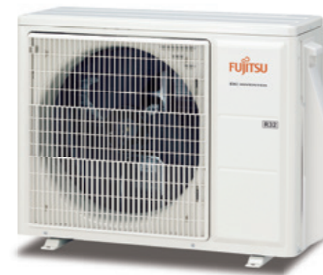
ASY 50-71 UI-KL