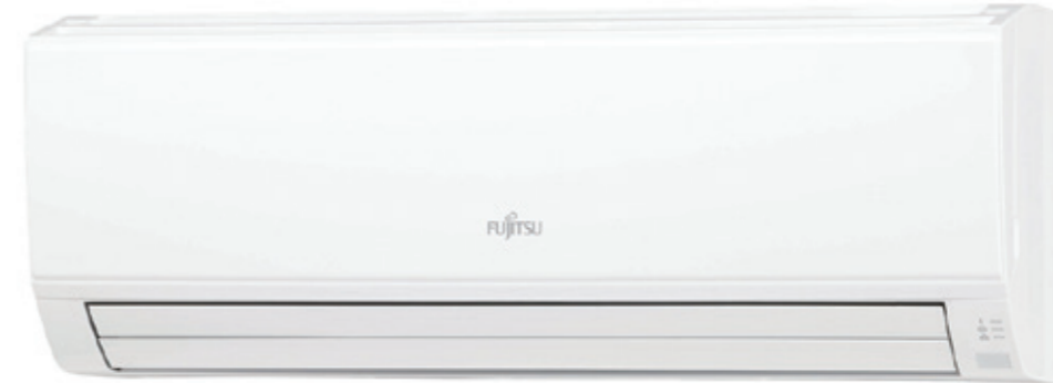
ASY 50-71 UI-KL